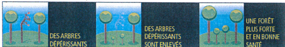
Illustration d'une coupe sanitaire

L'intervention est programmée sur une surface de 3,34 hectares .