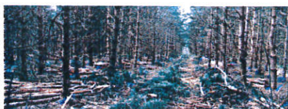
Principe des cloisonnements d'exploitation

Le rajeunissement des arbres est également un enjeu pris en compte dans la gestion de cette forêt. Des exploitations sont programmées chaque année afin de rajeunir, renouveler et éclaircir les peuplements.